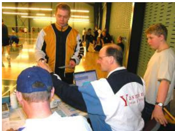
Travlhed ved dommerbordet