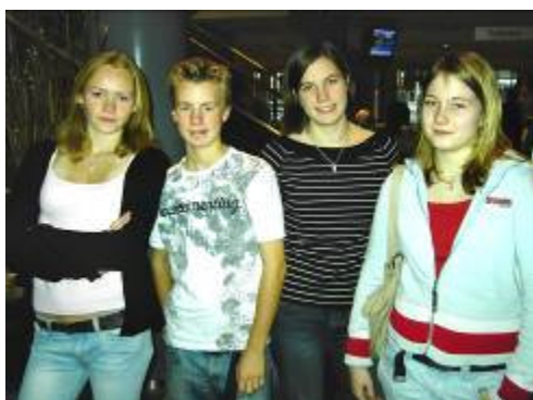
Vi lader billederne tale for sig selv.....