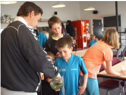
Herligt med et glassaftevand

Der blev trænet forskellige badmintonrelaterede øvelser, kun afbrudt af pauser. I disse pauser blev der pustet ud og inhaleret kage og safte-